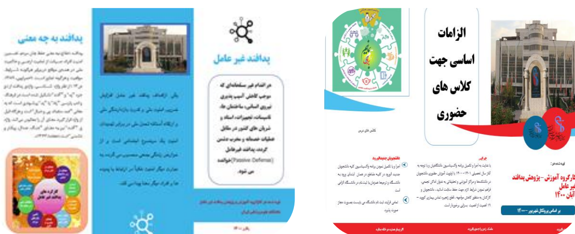
تصویر ۶: نمونه پمفلت آموزشی تهیه شده جهت کارکنان و دانشجویان (سال ۱۴۰۰)

۵- برگزاری جلسه هم‌اندیشی کارگروه آموزش و پژوهش