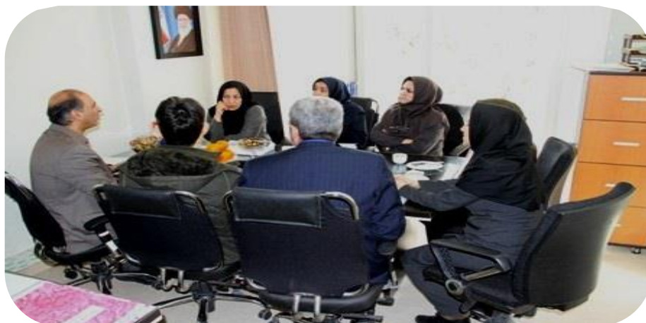
تصویر ۳: دانشکده پرستاری (سال ۱۳۹۷)

که در سال ۱۳۹۹ به علت پاندمی کووید- ۱۹ بصورت مجازی و با ارسال مستندات انجام شد.