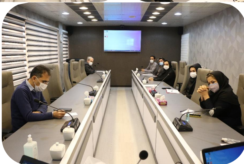
تصویر ۵: جلسه ارتقاء سلامت اداری، مسئولیت پذیری و پاسخگویی (سال ۱۴۰۰)