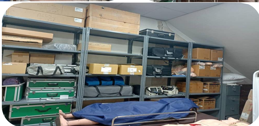
تصویر ۱۰: بعد از تخریب و بازسازی