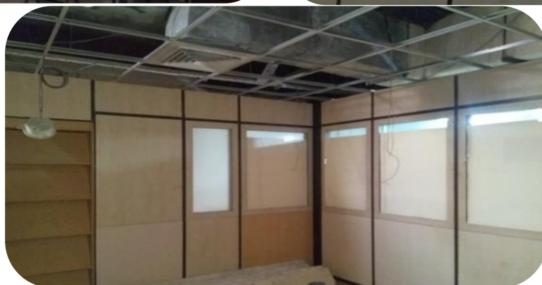
تصویر ۹: قبل از تخریب و بازسازی