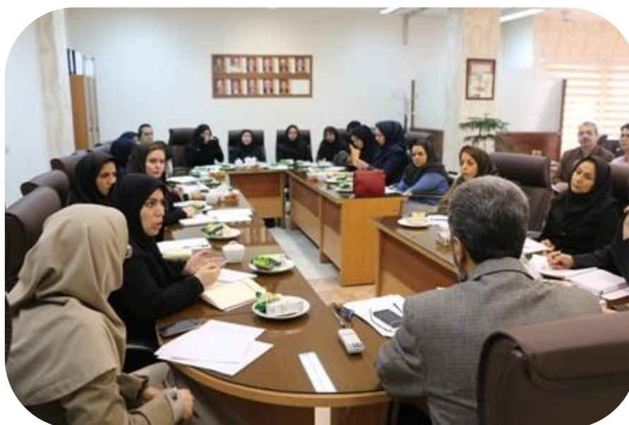
تصویر ۲: رتبه بندی آموزشی دانشکده‌ها (سال ۱۳۹۶)

به منظور ارزیابی و ارتقاء عملکرد دانشکده‌ها با ادغام سه مدل رتبه بندی، شامل رتبه بندی آموزشی دانشگاه علوم پزشکی کشور (طرح راد)، رتبه بندی خدمات آموزشی دانشگاه علوم پزشکی کشور (طرح رخاد) و در نهایت نظام ارزیابی عملکرد تحصیلات تکمیلی تهیه و تدوین گردید و طرح اولیه به کلیه دانشکده‌های تابعه ارسال شد که نتایج بازخورد و ارائه انتقادات و پیشنهادات در جلسات متعدد مورد بررسی و تجزیه و تحلیل قرار گرفت و پس از اعمال نتایج به دست آمده به دانشکده‌ها جهت اجرا ابلاغ شد.