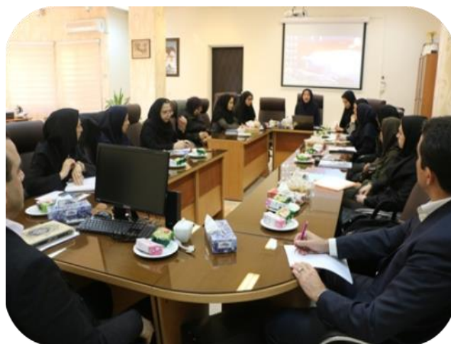
تصویر ۱: رتبه بندی آموزشی دانشکده‌ها (سال ۱۳۹۵)

به منظور ارزیابی و ارتقاء عملکرد دانشکده‌ها با ادغام سه مدل رتبه بندی، شامل رتبه بندی آموزشی دانشگاه علوم پزشکی کشور (طرح راد)، رتبه بندی خدمات آموزشی دانشگاه علوم پزشکی کشور (طرح رخاد) و در نهایت نظام ارزیابی عملکرد تحصیلات تکمیلی تهیه و تدوین گردید و طرح اولیه به کلیه دانشکده‌های تابعه ارسال شد که نتایج بازخورد و ارائه انتقادات و پیشنهادات در جلسات متعدد مورد بررسی و تجزیه و تحلیل قرار گرفت و پس از اعمال نتایج به دست آمده به دانشکده‌ها جهت اجرا ابلاغ شد.